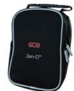
Sac de rangement pour accessoires

GCE S.A.S. 70 Rue du Puits Charles, BP N° 40110, 58403 La Charité sur Loire, France Téléphone : +33 (0)3 86 69 46 00 www.gcegroup.com