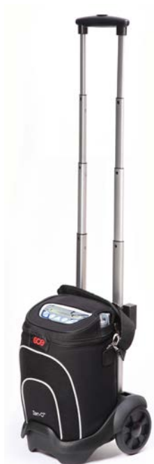
Le Zen-O™ avec sac et chariot