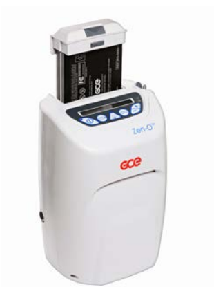
Le Zen-O™ peut contenir jusqu'à 2 batteries de 12 cellules

Un sac de rangement pour accessoires Zen-O™