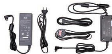
Cordon d'alimentation, alimentation AC et DC